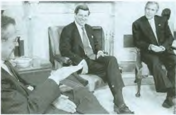
1 اجتماع في المكتب البيضاوي في 6 أيار/مايو، مع الرئيس جورج دبليو بوش ووزير الدفاع دونالد رامسفيلد